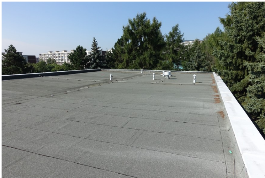
Pavilon „B“ : Střecha – celkový pohled