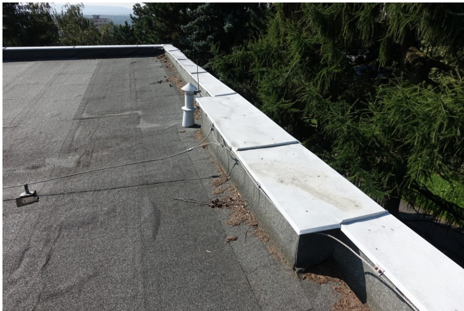
Pavilon „B“ : Střecha – atika