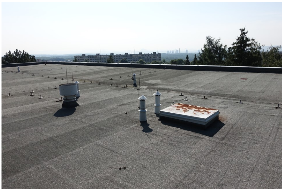
Pavilon „B“ : Střecha – odvětrávací hlavice VZT, odvětrávací hlavice kanalizace, střešní výlez